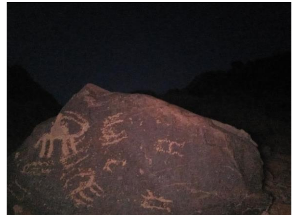
"نقوش ما قبل التاريخ - الهبالة"