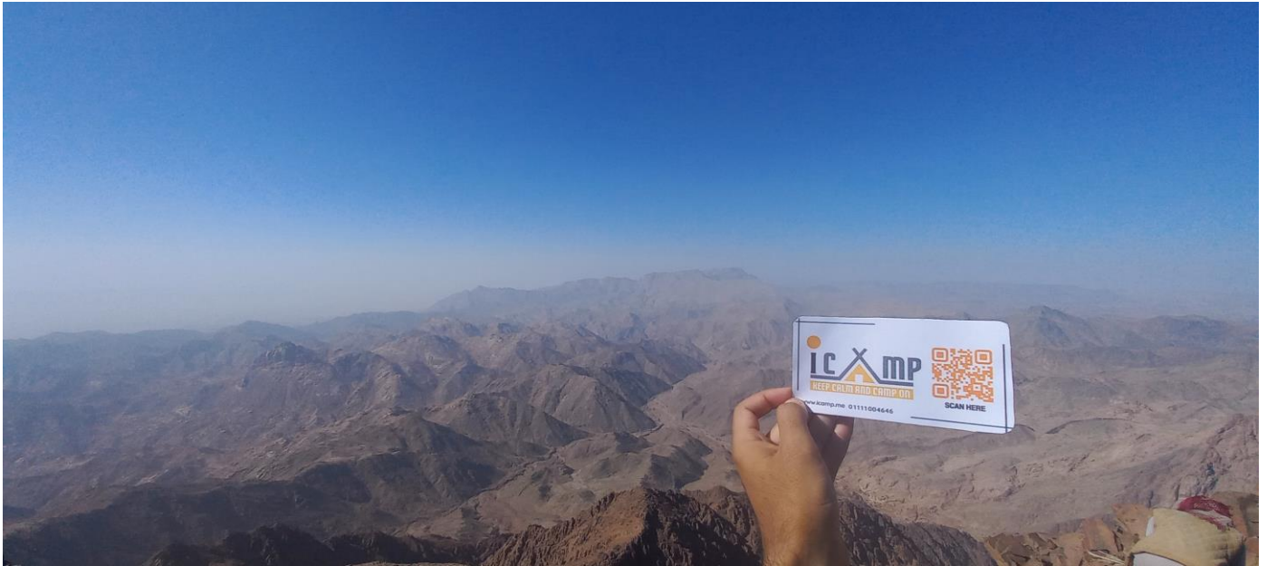
"أعلى جبل مدسوس"