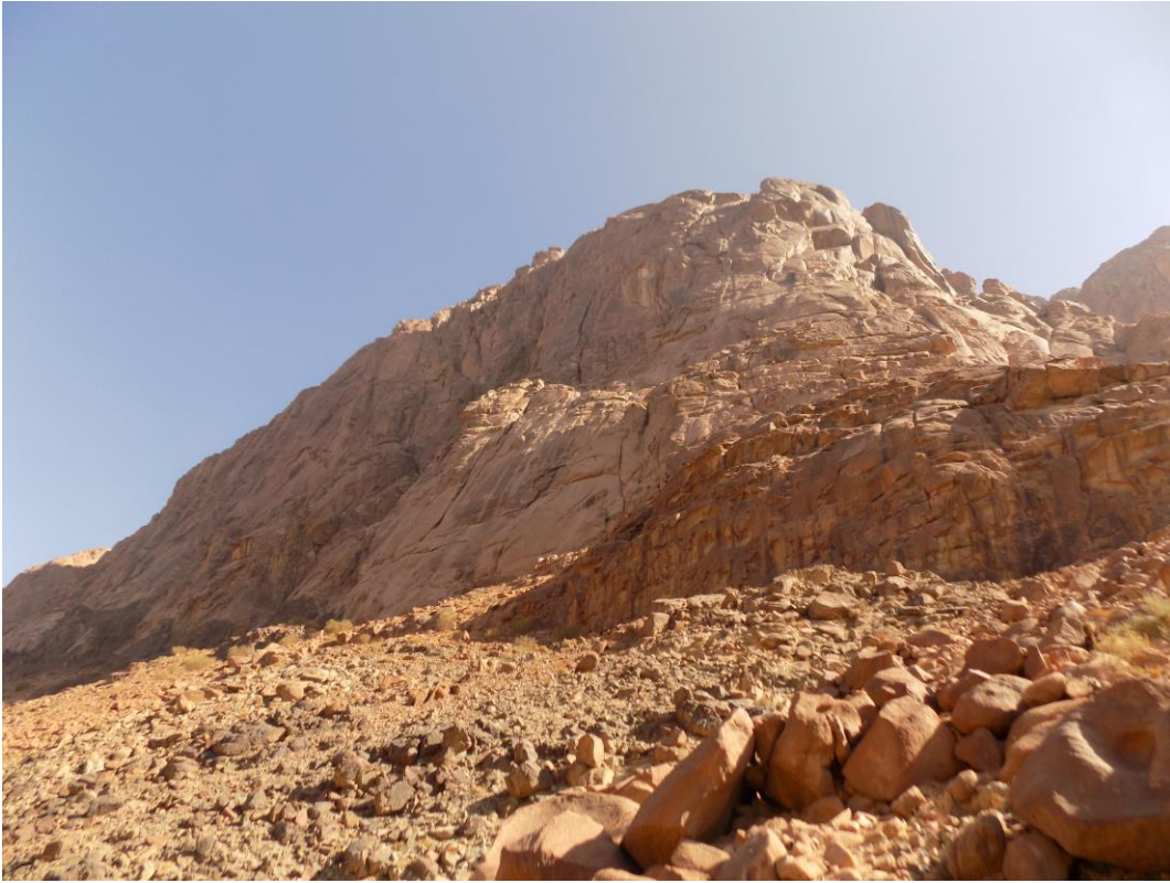
"جبل نعجة من سيل نعجة"