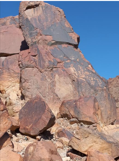
"نقوش ما قبل التاريخ - الريشة"