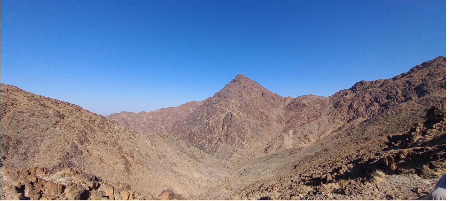
"جبل الطربوش من الفرعة"