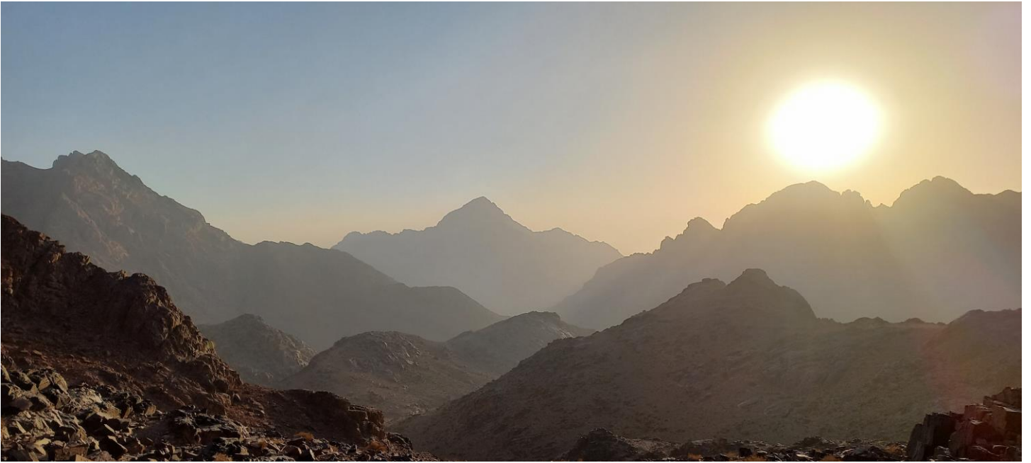
"من أعلى شرفة بغابة"