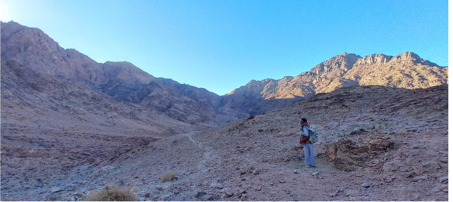
"جبل مدسوس من وادي بغابة"